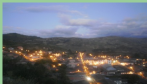
San Juan Bautista 2010