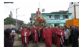
En Huambos San Juan 2010