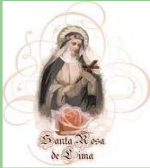
Santa Rosa de Lima Patrona del Perú y de las Filipinas