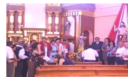
En Huambos San Juan 2009