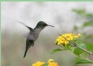
La Primavera en Trujillo