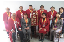
En Chiclayo Octubre 2009