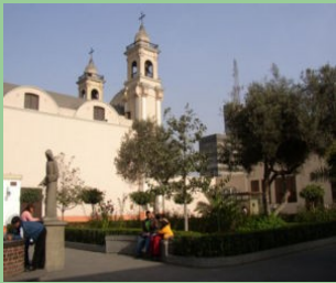
Claustro de Santa Rosa